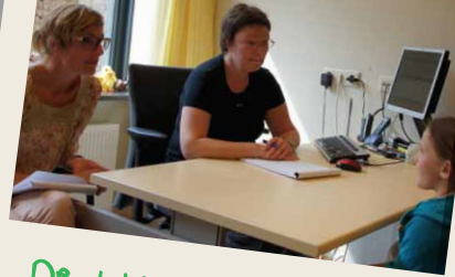
De dokter en psycholoog

Als je in Kempenhaeghe blijft slapen, ontmoet je op de opnameafdeling verpleegkundigen. Dan is er meestal een verpleegkundige die speciaal voor jou zorgt. Op de polikliniek werken verpleegkundig specialisten. De verpleegkundig specialist is iemand waar je naar toe kunt gaan als je bijvoorbeeld vragen hebt over onderzoeken, over wat er met je aan de hand is of over medicijnen. Die kan je daar uitleg over geven.